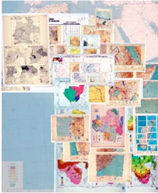
Quelques fonds cartographiques du Laboratoire de Graphique de l'EHESS

La plateforme géomatique porte une partie de l'héritage du laboratoire de graphique de l'EHESS fondé par Jacques Bertin. Depuis, les méthodes de conception de cartes et surtout des analyses qui peuvent en découler ont bien changé et s'insèrent à la fois dans le paradigme du « Spatial Turn » au début des années 2000 et qui rebondit aujourd'hui dans les « Spatial Humanities ». L'objectif est donc de promouvoir les ressources numériques, les données et les connaissances, acquises ou produites par les chercheurs de l'EHESS sur une multitude de projets émanant de disciplines des sciences humaines et sociales (histoire, géographie, archéologie, anthropologie, ethnologie, etc.) ayant vocation à spatialiser des informations. Notre présentation s'articulera autour de plusieurs projets phares auxquels la plateforme collabore et portera sur le SIG, l'analyse spatiale, le traitement automatique des langues, l'intelligence artificielle et l'apprentissage automatique et le Web sémantique.