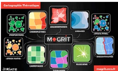
Cartographie thématique avec MAGRIT

Dans le cadre de sa mission « Méthodes et outils pour l'analyse territoriale » l'UMS RIATE structure une partie de ses activités autour de la mise en œuvre de méthodes d'analyses spatiales et du développement d'outils de cartographie. À ce titre, deux solutions de cartographie sont proposées actuellement et visent deux types de besoins de production différents : (1) L'application en ligne MAGRIT a été pensée comme un support à l'enseignement de la cartographie thématique. Son interface graphique est calquée sur le raisonnement suivi lors de la conception d'une carte. (2) Le package « cartography » est une extension du logiciel de statistique et de visualisation libre R. Dans une démarche de recherche reproductible, le package répond au besoin d'intégrer la cartographie dans des chaînes de traitement complètes, comprenant notamment l'acquisition de données ou la statistique.